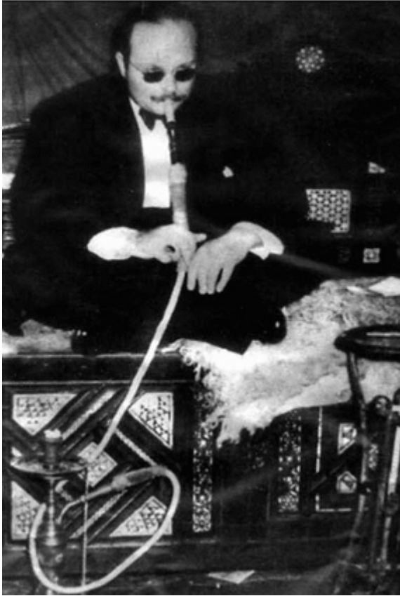
الملك فاروق يدخن الشيشة