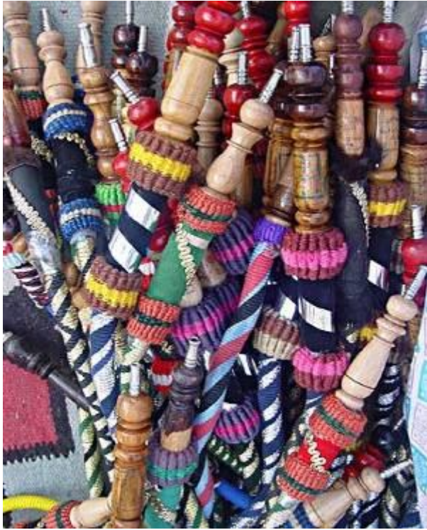
مجموعة مباسم على لآيات مزخرفة