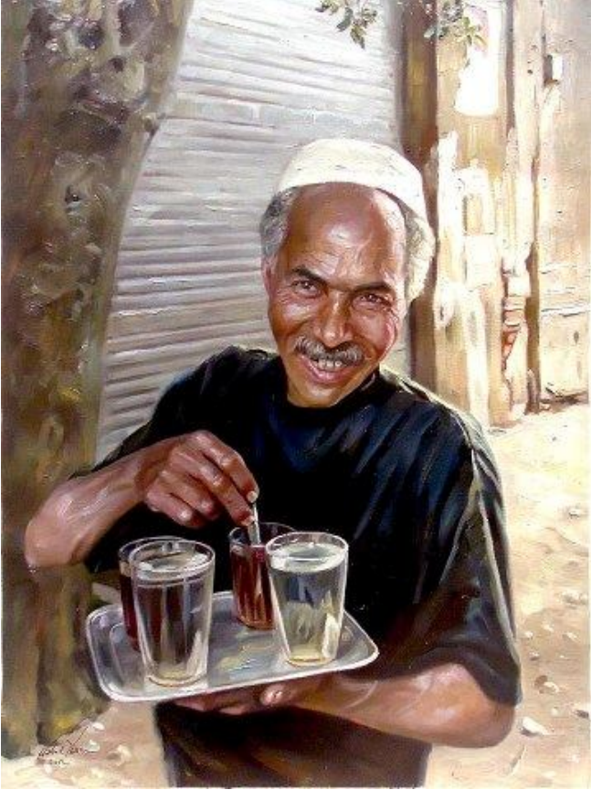
القهوجي - من أعمال الفنان وليد ياسين