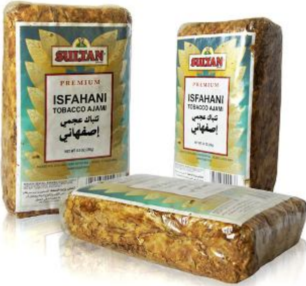
تمباك عجمي اصفهاني