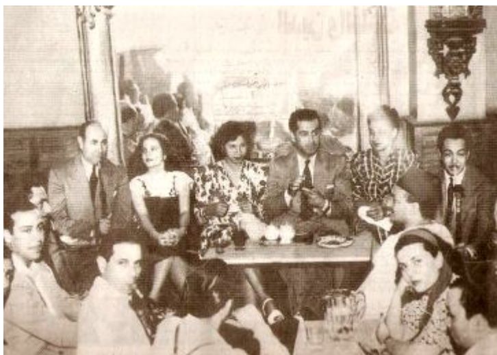
مجموعة من فناني الزمن الجميل على مقهي الفيشاوي