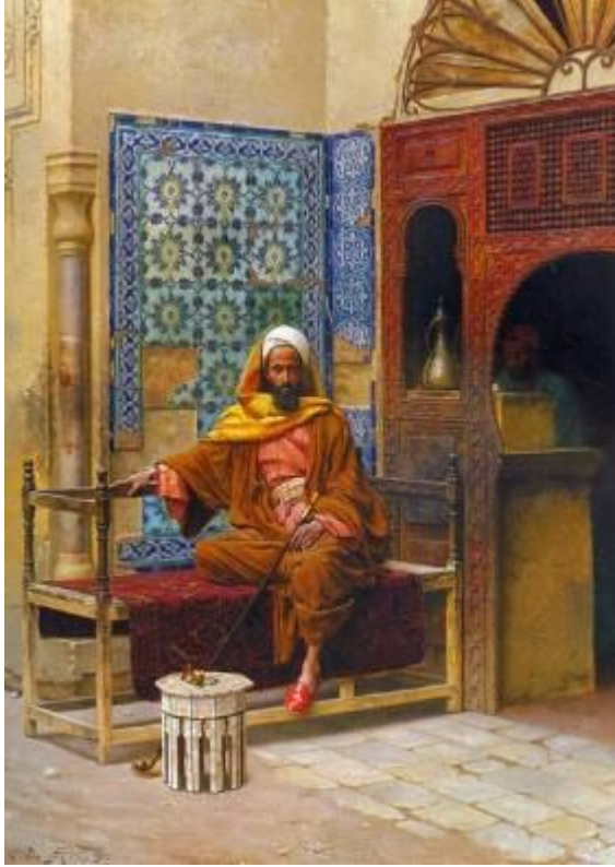
مقهى في القاهرة 1903، من أعمال المستشرق لودفيج دويتش