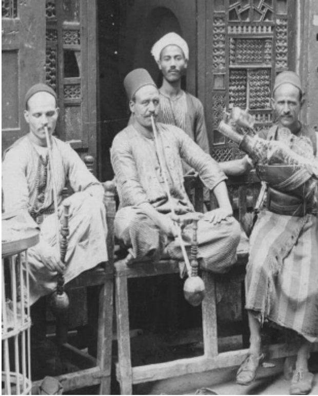
تدخين الجوزة على مقهى بلدي قديم