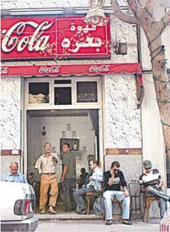
قهوة بعرة بشارع عماد الدين، ملتقى الكومبارس