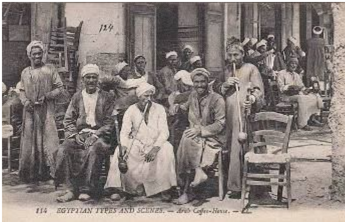
مقهى قاهري في بداية القرن العشرين