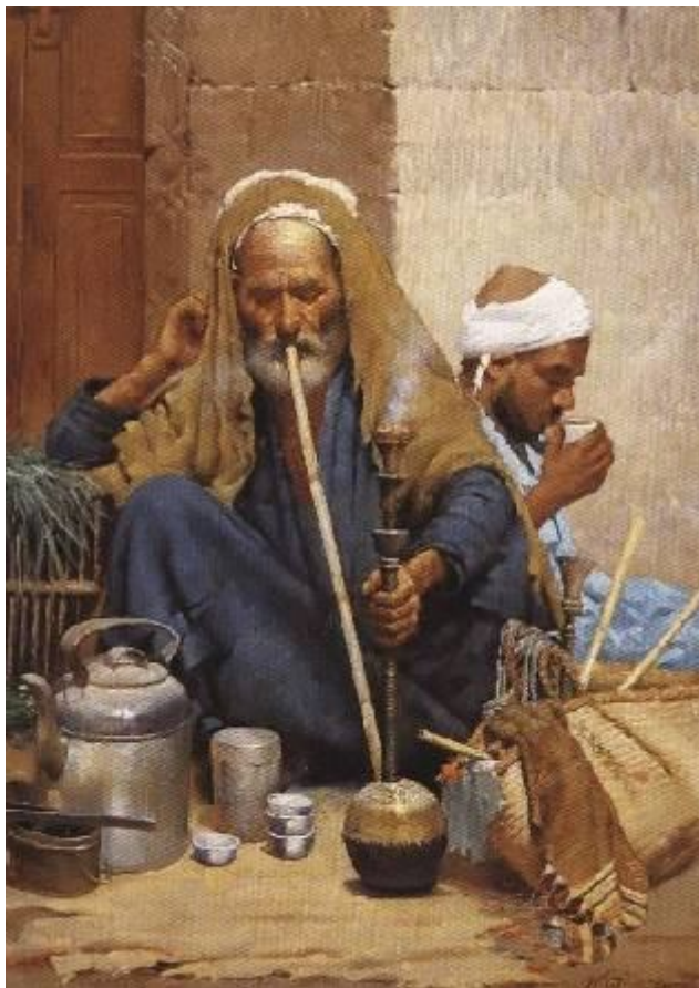
قهوة بلدي، القرن التاسع عشر - لوحة للمستشرق الإيطالي نيكولا فورشيللا